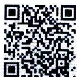
国家反诈中心 微博