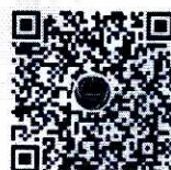
国家反诈中心 快手