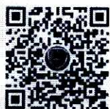
国家反诈中心 微信视频号