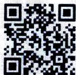
国家反诈中心 人民号